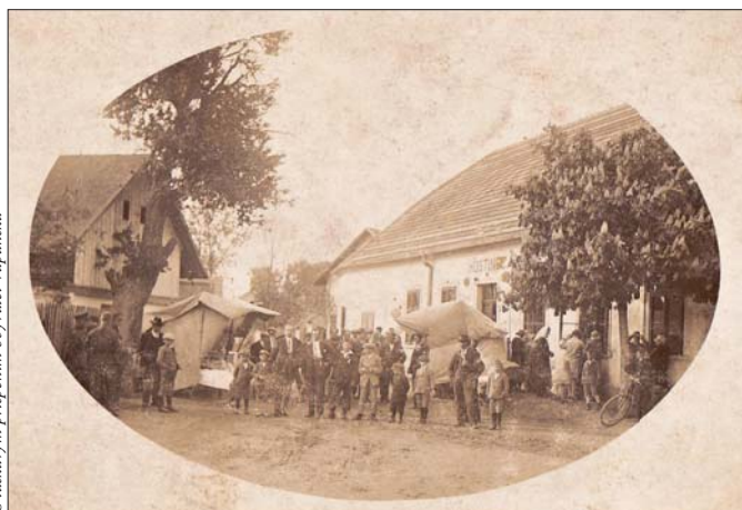
S laskavým přispěním obyvatel Vápenska