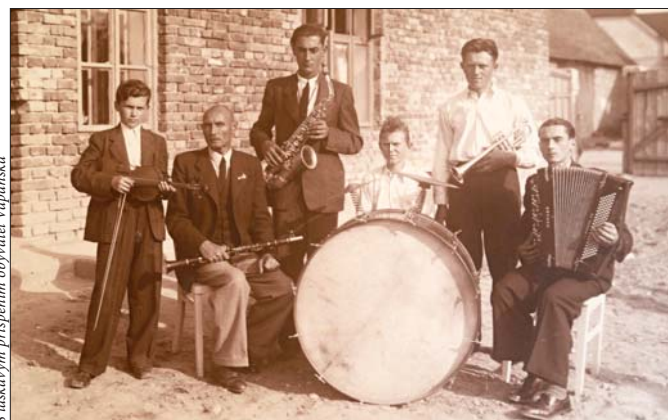
S laskavým přispěním obyvatel Vápenska