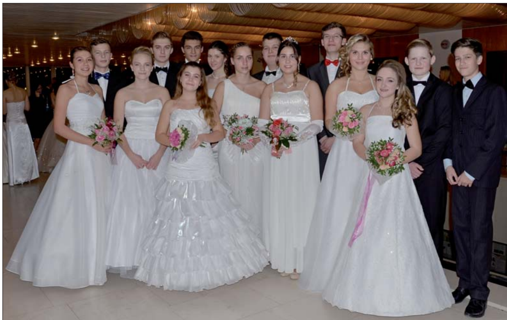
Loňský závěrečný taneční věneček

Autoři: Eliška Apjarová, Thalie Petráňová, Klára Dytrychová, Barbora Šilarová