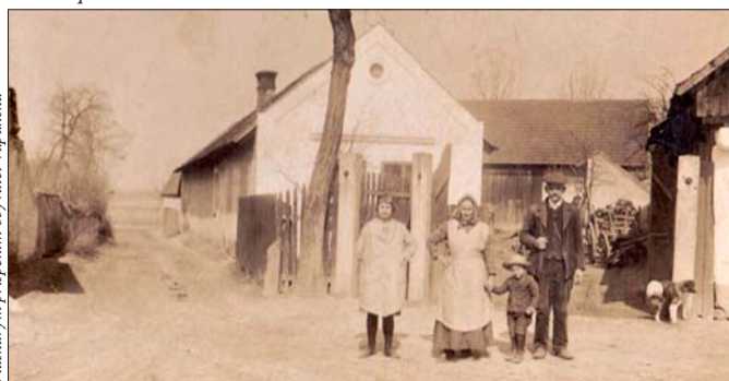
S laskavým přispěním obyvatel Vápenska